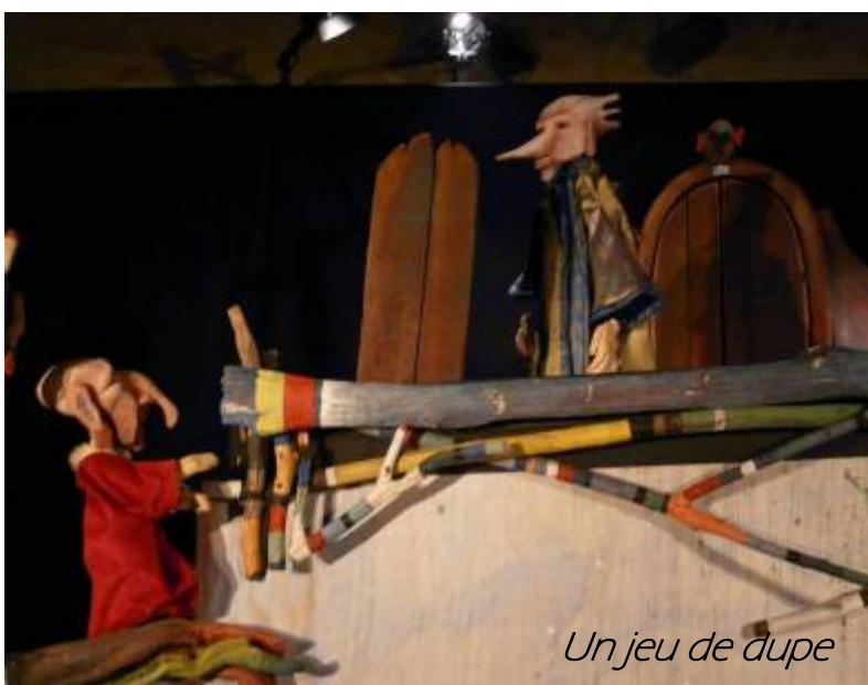
Un jeu de dupe

Spectacle jeune public et familial (conseillé à partir de 6 ans)